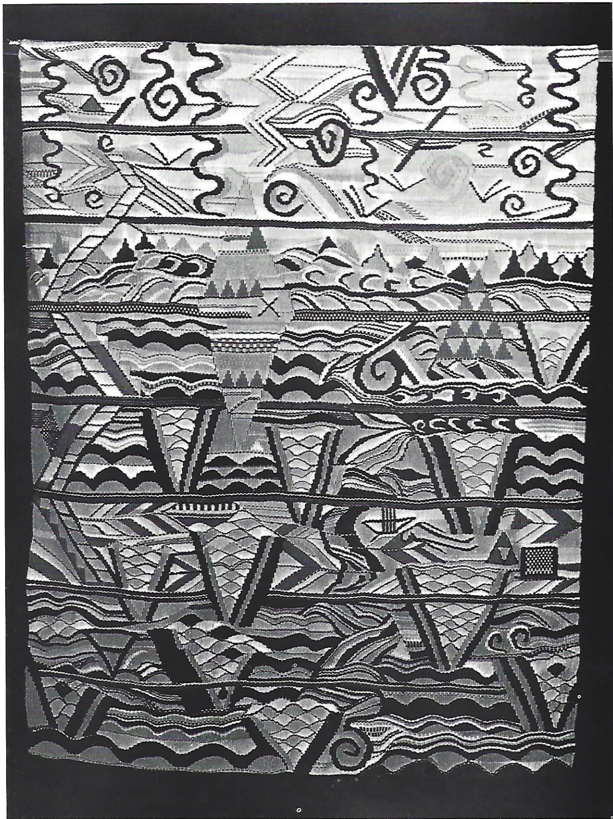
Tapiz «Paisaje» 150 x 200 cms. Sevilla, 1986