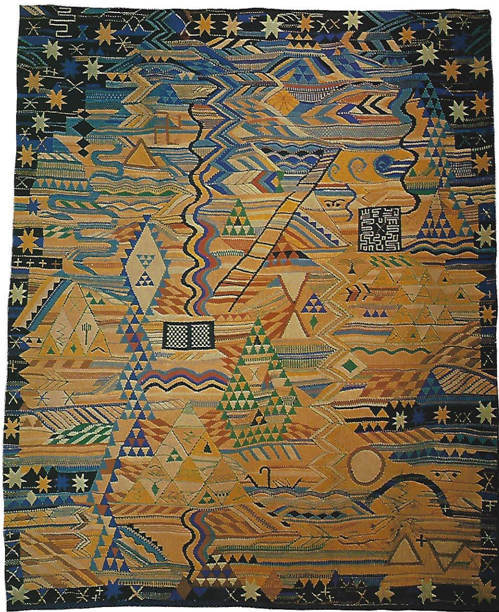
Tapiz «El sueño» 235 x 285 cms. Sevilla, 1986