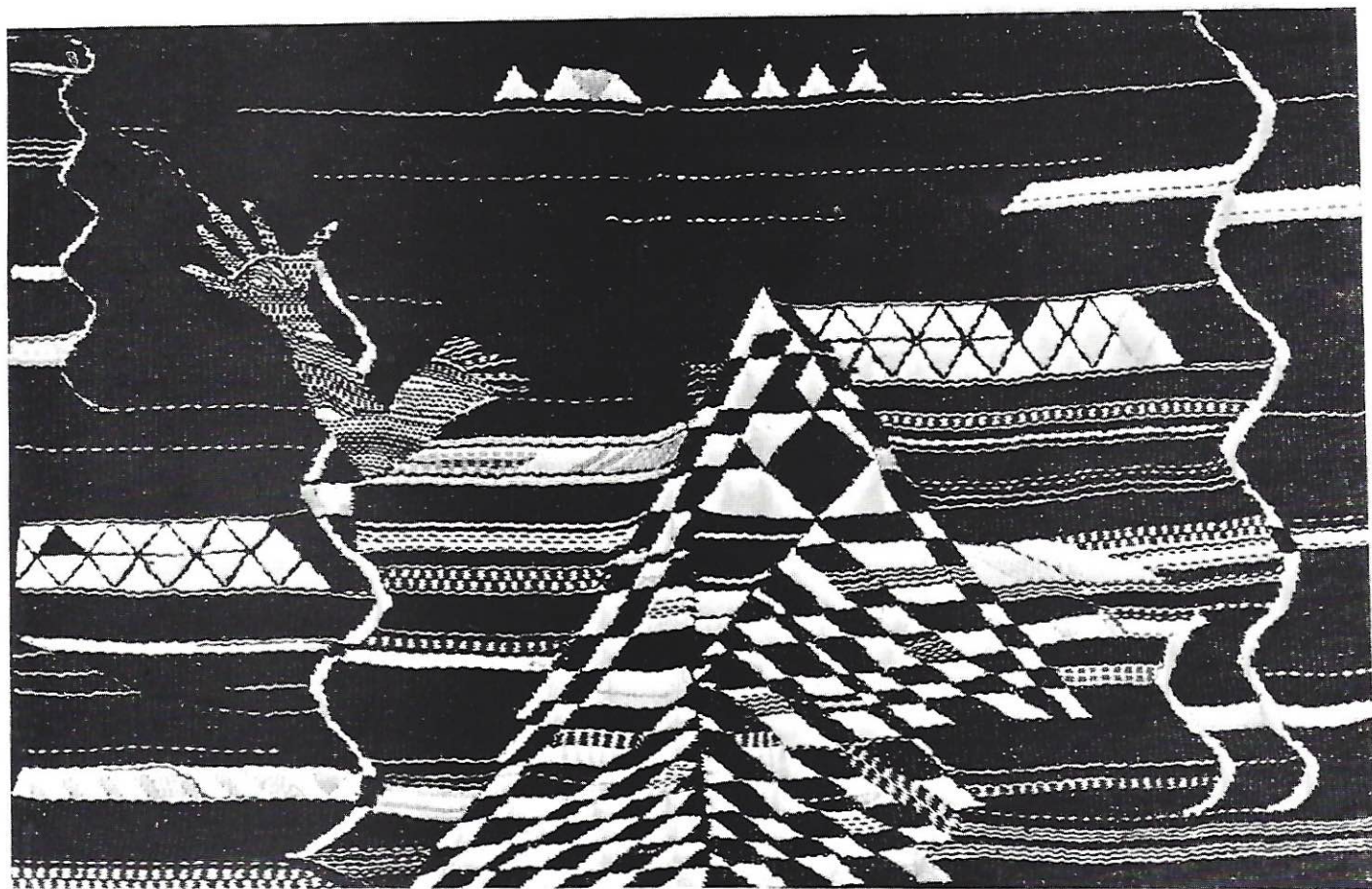
Tapiz S/T 170 x 120 cms. Sevilla, 1985