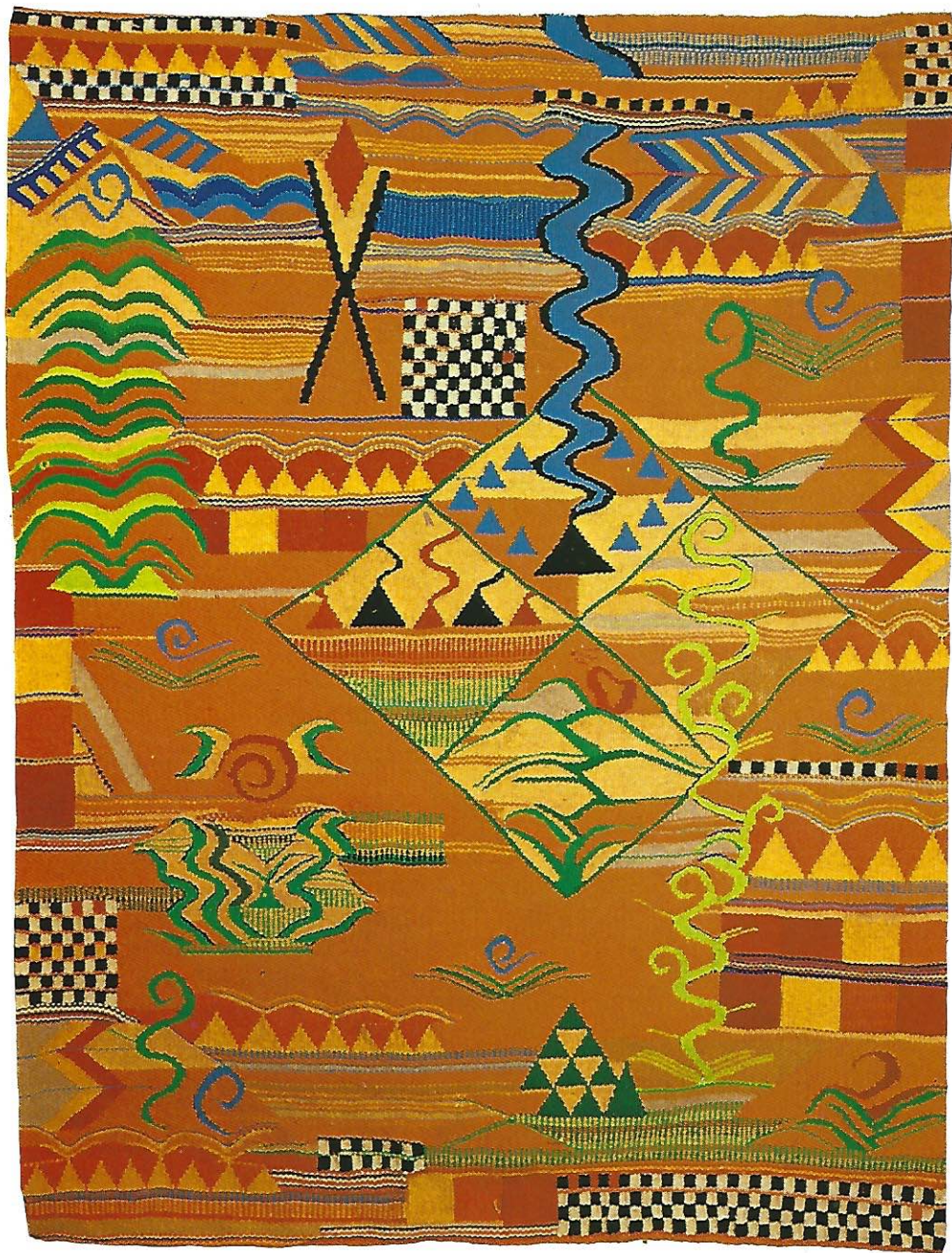
Tapiz «Paisaje» 150 × 185 cms. Sevilla, 1987